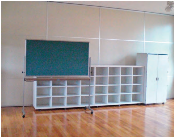
[設置例] 移動式スチール黒板 900×1800